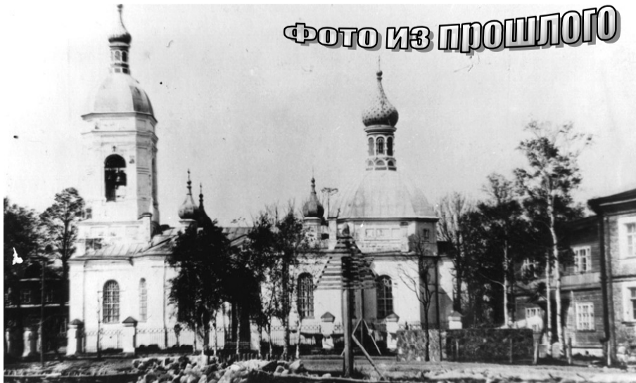
Фото не существующего сегодня храма во имя Пророка Илии в селе Скамья (взорван в 1944 г.). Строился тщанием местных выходцев из крестьян (впоследствии купцов) Громовых. Потомки династии Громовых живут сегодня в Австралии.

Храм отличался богатым убранством и имел колокол в 200 пудов. На его месте сегодня, к нашему сожалению, возвели дом.