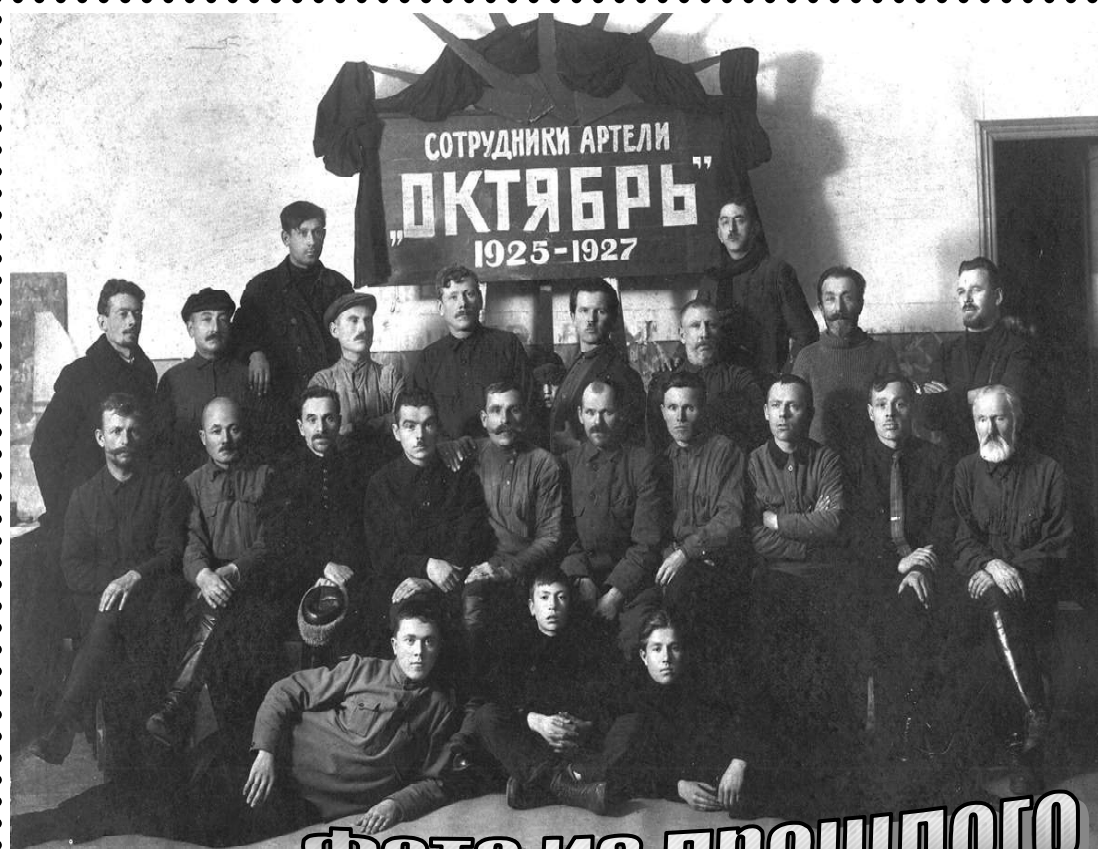
Фото из прошлого