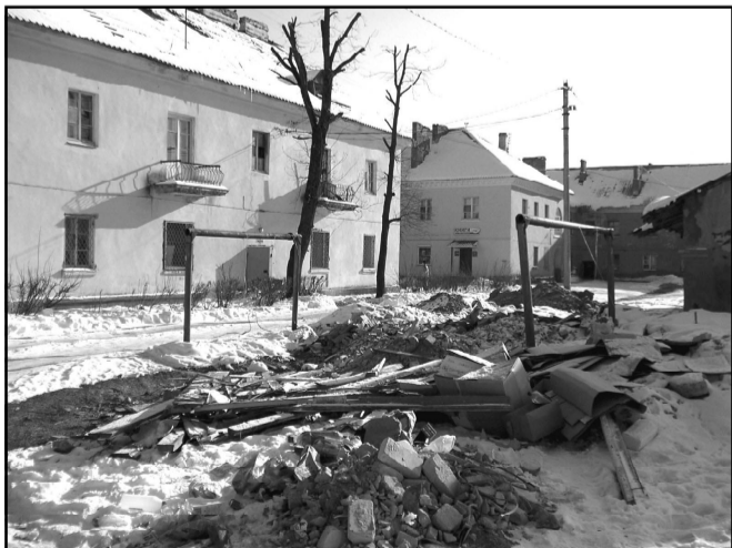
Фото и текст В.ГОРДЕВОЙ

Однако грешат не только квартиросъемщики, выбрасывающие мусор куда попало, но и некоторые организации. Вот, к примеру, при реконструкции помещений магазина «Подарок», что находится в самом центре города, строительный мусор просто сваливался на внутридомовую территорию у жилого дома № 31 по улице Кирова. А это, между прочим, является грубейшим нарушением «Правил внешнего благоустройства города и сельских поселений МО «Сланцевский район». Комиссия выдала предупреждение о вывозе мусора и приведении придомовой территории в порядок подрядной организации ООО «ССК», которая ведет строительные работы. Надо отдать должное ООО «ССК», так быстро еще никто на замечания не реагировал. В тот же день весь мусор был вывезен, и у дома, где он лежал, теперь чисто, приятно посмотреть. А было вот так, как на этом снимке.