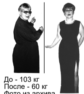
До - 103 кг После - 60 кг

Врачи различных специальностей хорошо знают, что избыточный вес – это не только косметологическая проблема, но и серьезная проблема здоровья. Раздавленные суставы (артроз), позвоночник (остеохондроз), распухшие вены на ногах – это только верхушка айсберга. У полных людей со временем неизбежно развивается гипертония – с ее головными болями, постоянным приемом таблеток и риском инсульта. Сахарный диабет и камни в желчном пузыре тоже не прибавляют радости в жизни. Изменяется гормональный фон, отсюда при выраженном ожирении – половые расстройства (бесплодие, снижение потенции)... Получается, что хорошая фигура – не каприз, не дань моде, а необходимое условие здоровья.