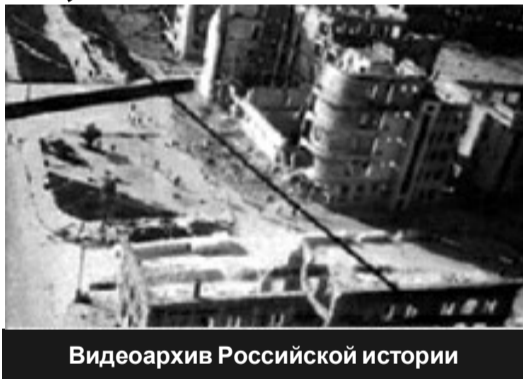
Видеоархив Российской истории

Сталинград горел, взывая к мщенью, От разрывов пенилась река. Боевое принял там крещенье Наш Второй родимый ГМК! Паулс - в котле, как в мышеловке, А Манштейн хотел освободить, Но на деле получилось ловко: Мы обоим дали «прикурить»! «По машинам» - пятый раз в атаку На Миусе шли мы знойным днем, И горели вражеские танки, Как костры возмездия, огнем! Пофамильно даже фрицы знали Молодых отчаянных ребят, Что ходили в ночь за «языками» - Боевой, ударный разведбат! Хоть бомбили, и свистели пули,