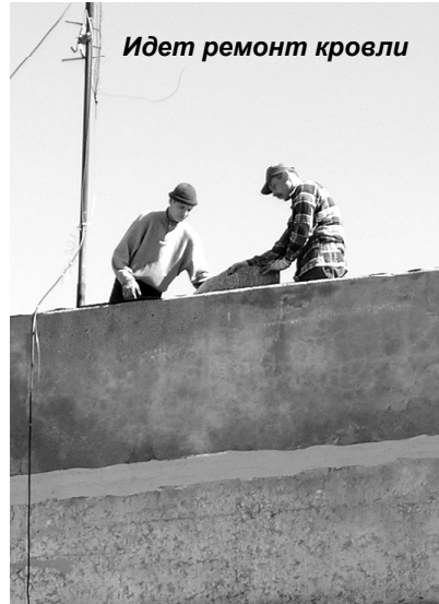
Идет ремонт кровли

Большой объем ремонтных работ запланирован на производстве «Водоканал». На водозаборе уже отремонтирована кровля реактентного корпуса; будет капитально отремонтирован еще один скорый фильтр, что заметно улучшит качество очистки воды и уменьшит коли-