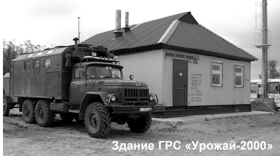
Здание ГРС «Урожай-2000»

Если еще в начале этого года к месту строительства ГРС можно было подъехать лишь на гру-