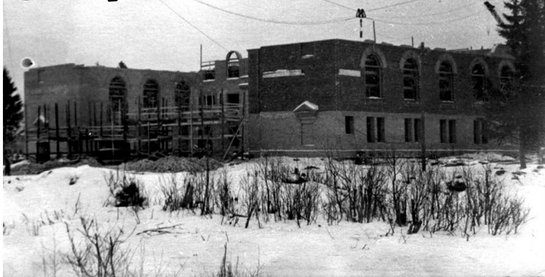
Строительство Дома Культуры СПЗ «Сланцы». Начало строительства - декабрь 1953 года. Первое торжественное заседание - ноябрь 1956 года. Фото из архива и текст В. БУДЬКО