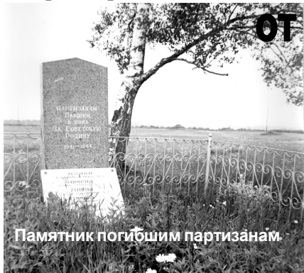
Памятник погибшим партизанам.

Из акта районной комиссии по установлению и определению убытков и злодеяний, совершенных немецкими властями на территории Сланцевского района с 17 июля 1941 года по 1 февраля 1944 года.