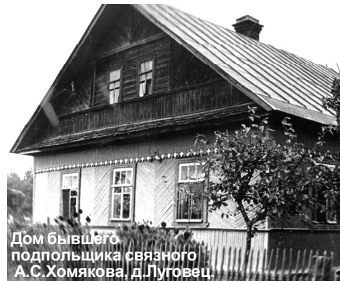
Дом бывшего подпольщика связного А.С.Хомякова, д.Луговец.

Акт комиссии был составлен 5 мая 1944 года.