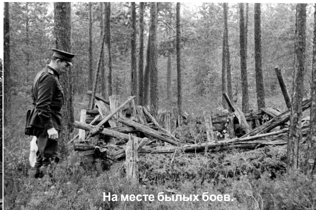
На месте бывших боев.