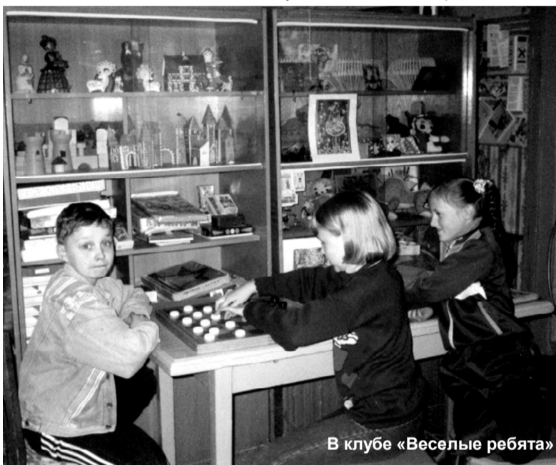
В клубе «Веселые ребята»