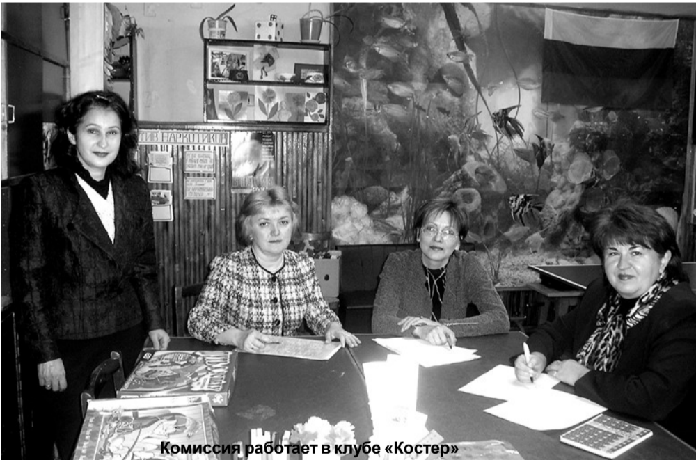
Комиссия работает в клубе «Костёр»

ет оборонно-спортивный лагерь: ребята и физически закаляются, и осваивают азы военного дела,