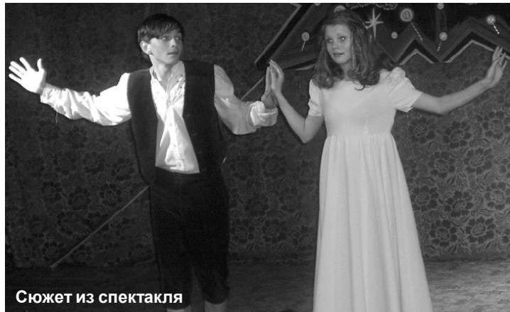
Сюжет из спектакля

второстепенная роль осьминога, а какая удачная! Она разрядила напряжение,