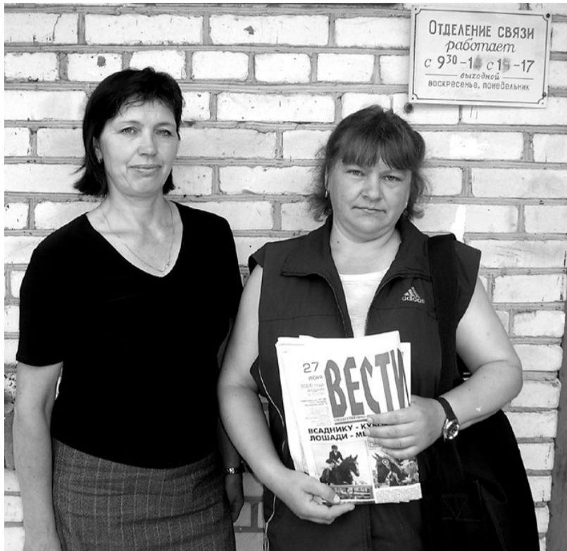
ОТДЕЛЕНИЕ СВЯЗИ работает с 9:30-18 с 15-17 выходные воскресенье, понедельник