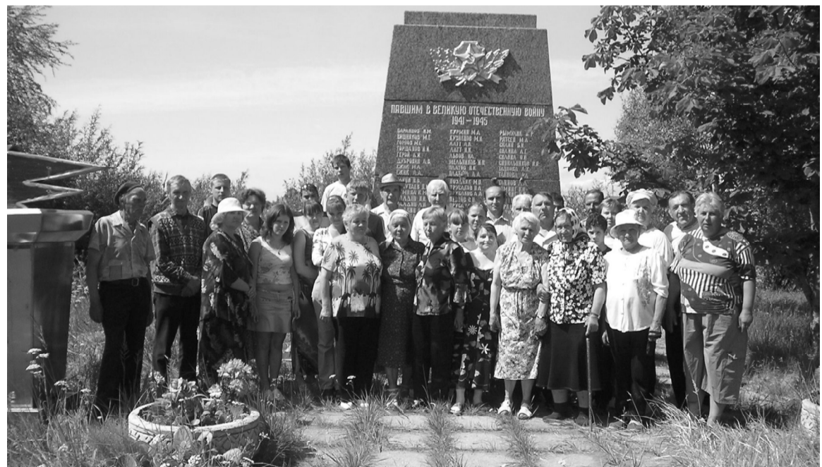
ФОТО И ТЕКСТ Т. КРЫЛОВОЙ