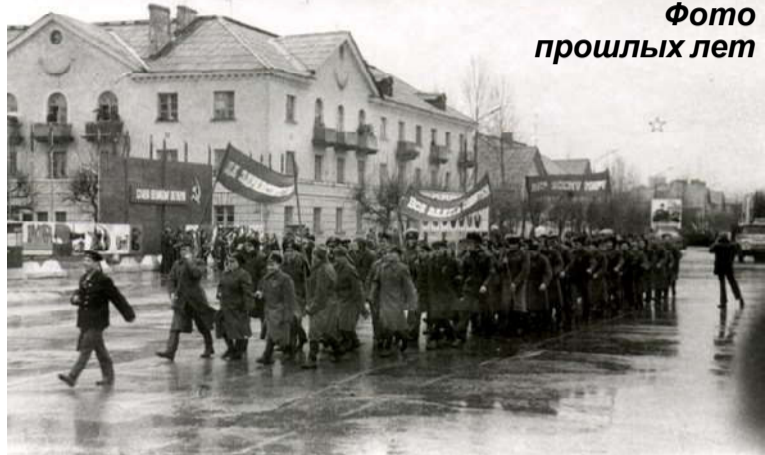
Фото прошлых лет

В кратком хронологическом справочнике «История сланцевского района в датах», выпущенном в 2000 году при участии архивного отдела администрации нашего города, библиотеки и историко-краеведческого музея, начало строительства микрорайона Лучки датируется 1946 годом. Выставка фотографий из домашних архивов уже вторую неделю радуется сланцевчан в витринах центральной городской библиотеки. Люди с нескрываемым интересом рассматривают каждую деталь здания, ландшафтов, каждое лицо. Узнают друзей, соседей, одноклассников, знакомых. Приезжают на автомотобиль всей семьей посмотреть выставку.