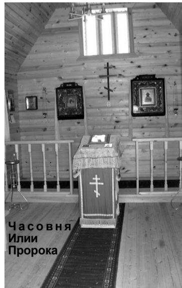
Часовня Ильи Пророка

Сфотографироваться моему собеседнику всё же пришлось. С троюродным бра-