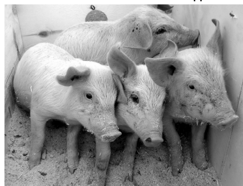
Фото и текст В.ГОРДЕВОЙ.

Родители с детьми смогли не только что-то приобрести на ярмарке, но и поучаствовать в играх, аттракционах. А сколько радости детворе доставили надувные батуты «Горка» и «Собака»! Мы не говорим ярмарке «Прощай», а только «До свидания», потому что в следующем году скажем ей: «Добро пожаловать!».