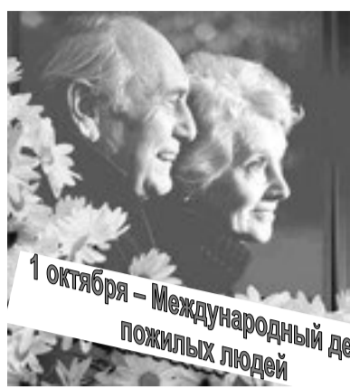
1 октября – Международный день пожилых людей

Дорогие сланцевчане! В первый день октября весь мир отмечает Международный день пожилых людей.