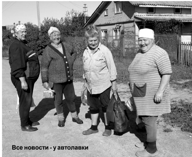
Все новости - у автолавки

Время прощаться. Ещё раз возвращаемся к теме строительства часовни. Вокруг святого места сложилось немало добрых традиций. В самой часовне хранится Книга памяти, где навечно записаны имена жителей деревни. Более ста из них героически погибли на полях сражений в годы Великой Отечественной войны. По инициативе жителей деревни в честь 60-летия Победы вокруг часовни заложили Рощу памяти. Говорят, самое активное участие и в строительстве, и в нынешнем благоустройстве часовни принимают дети, молодежь. Добрые дела на благо родной земли как ничто другое объединяют и воспитывают чувство уважения к малой родине.