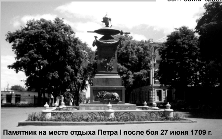
Памятник на месте отдыха Петра I после боя 27 июня 1709 г.