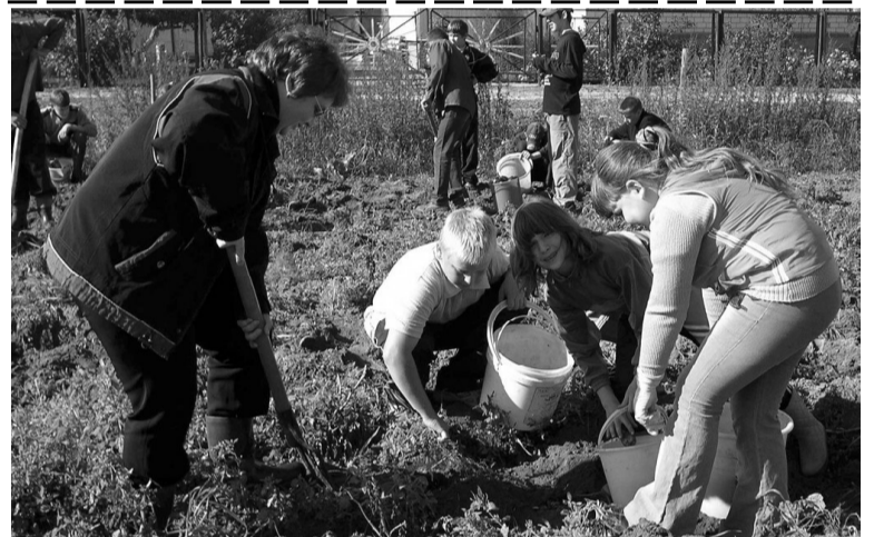
Учащиеся 6-9 классов Высокотской школы после уроков в течение двух недель помогли ЗАО «Родина» в уборке картофеля. Работали не только в поле, но и в картофелехранилище - отбирали побитые, испорченные клубни на корм скоту. Ребята убрали и урожай картофеля на пришкольном участке. Выращены здесь и различные овощи - кабачки, капуста, свекла, морковь. Все это пойдет в школьную столовую - на приготовление вкусных и полезных блюд.

И все-таки не исключено, что процесс дальнейшей специализации ЗАО «Родина» продолжится. Год назад пришлось отказаться от свиноводства из-за убытков, которые принесла эта отрасль. В последние годы нет сокращения площадей под картофель и овощи. Все большее значение теперь приобретает наше основное направление - молочное животноводство. Поставки молока ведутся в ОАО «Пискаревский молочный завод» без ограничений по объемам, а обеспечение надлежащего качества продукции - в традициях ЗАО «Родина».