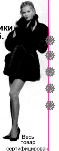
Весь товар сертифицирован

новая коллекция из натурального меха нутрия - от 5 500 руб. овчина - от 6 000 руб.