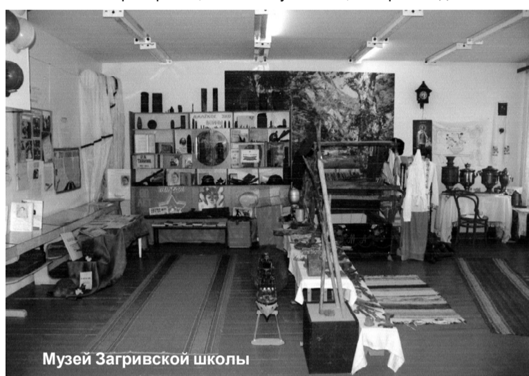
Музей Загивской школы

Хорошо известен в районе и музей Загивской школы. Создан он в мае 1995 года с целью изучения быта жителей Принаровья, боево-