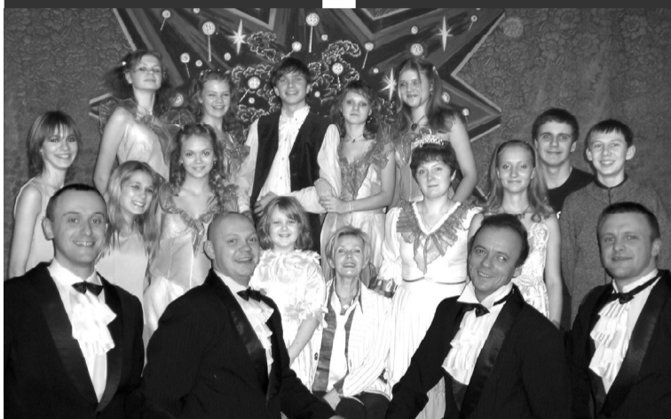
творческого пути и успеха.

апра. А за все годы существования театра им создано и показано более 40 спектаклей русской, современной и зарубежной классики. Прошло более 30 театральных гостиных и поэтических композиций. Каждый юный сланцевчанин хоть раз побывал на спектаклях в театре «БУМС».