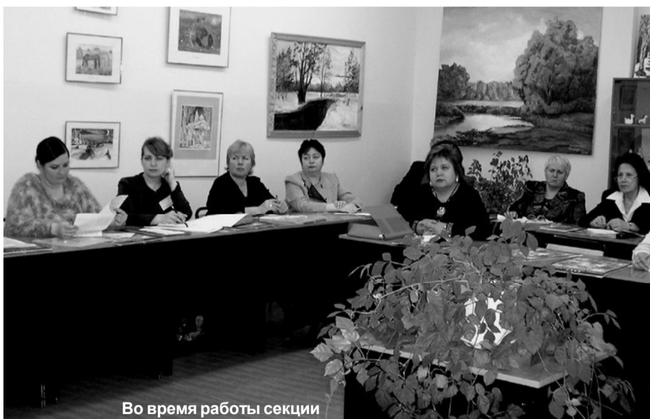
Во время работы секции

и профильного обучения старшекласников, о развитии материально-технической базы системы образования. Наряду со средствами, выделяемыми победителям конкурса инновационных школ и конкурса учителей, в рамках проекта выделяются средства на оснащение школ учебными пособиями и оборудованием, на приобретение автобусов сельским школам, на подключение школ к сети Интернет. В школы области будет поставлено 10 автобусов, 53 комплекта учебного оборудования. До конца текущего года 211 школ области будут подключены к сети Интернет.