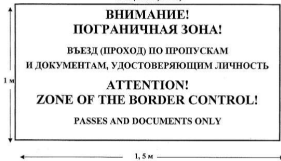
Приложение 1 к Правилам (п. 1.1) Образец предупреждающего знака, устанавливаемого в местах въезда (прохода) в пограничную зону

Примечание. Предупреждающий знак, устанавливаемый в местах въезда (прохода) в пограничную зону, представляет собой щит синего цвета, покрытый светоотражающим материалом. Надписи на щите выполняются на русском и английском языках белым шрифтом. Размеры знака: высота — 1 м; ширина — 1,5 м. Размеры букв в надписях: высота — 10 см (7 см); ширина — 7 см (3 см). Межстрочный интервал — 5 см. Расстояние от земли до нижнего края знака — 1,5 м.