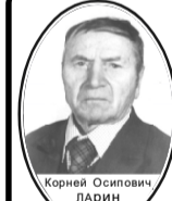
Фото на эмали за одни сутки цена 500 рублей 8 911 265 23 30