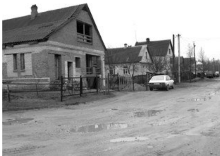
Фото и текст В.ГАЛКИНОЙ.

Полюбили Гавриловскую и так называемые «новые русские». Построили уже свою целую улицу. Не бывает недели, чтобы кто-то не поинтересовался продажей дома или земельного участка, которые стоят здесь недорого. Что и говорить, модная нынче тенденция – поселиться поближе к земле. Еще бы перенять новым сельчанам вековые деревенские традиции – гостеприимство и умение объединиться для решения общих проблем.