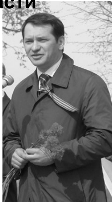
всегда был первый тост, стоя, за Победу, второй, стоя, — за павших, третий, стоя, — за победителей. А сейчас четвертый тост, тоже стоя, — за Знамя Победы!