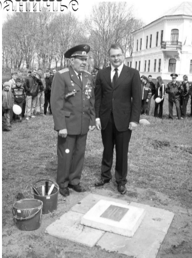
жества, несгибаемой воли и великой любви к Родине».