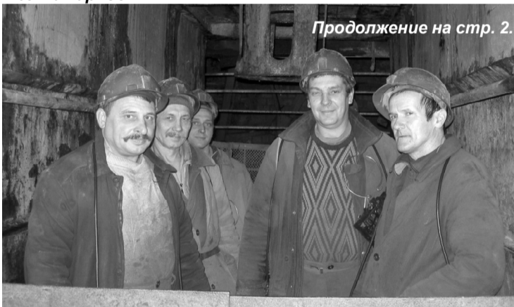
Продолжение на стр. 2.

В озобновление производственной деятельности ОАО «Ленинградсланец» действительно стало знаменательным событием как для коллектива этого градообразующего предприятия, так и для всего города. На наряде на шахте «Ленинградская» 15 января присутствовали руководители города и района. Торжественность момента была подчеркнута визитом губернатора Ленинградской области В.П.Сердюкова, который выступил на наряде.