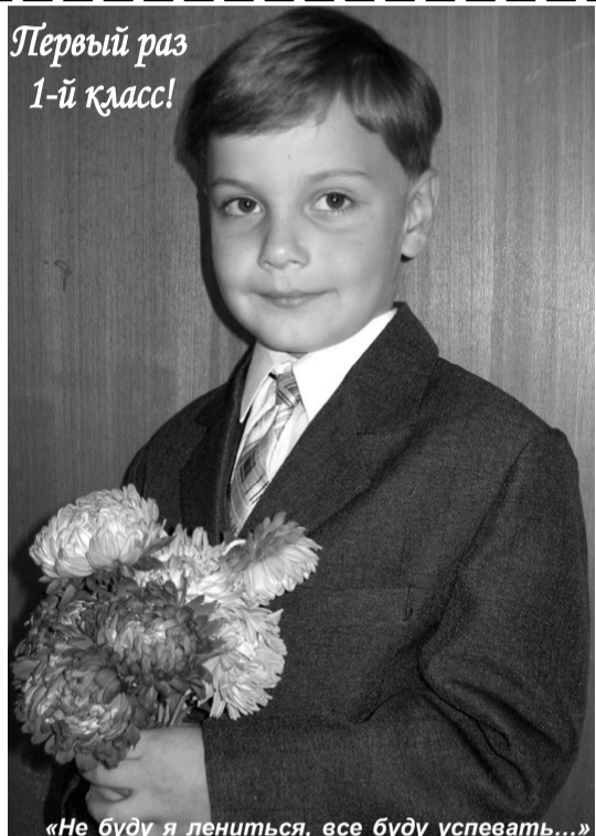
Первый раз 1-й класс!