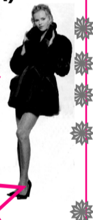
Весь товар сертифицирован.

ШУБЫ НОВАЯ КОЛЛЕКЦИЯ из натурального меха: нутрия – от 5500 руб., овчина – от 6500 руб. При покупке шубы свыше 20000 руб. – шапка 3200 руб. в подарок! (Акция до 30 сентября)