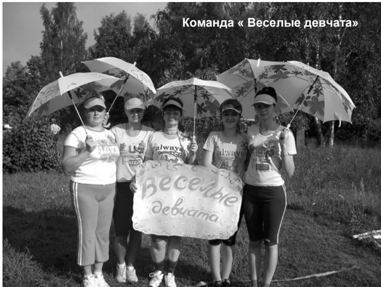
Команда «Веселые девчата»

Затем состоялось представление команд – их названия, девиза, эмблемы, что было домашним заданием. Жюри оценивало их оригинальность. Оценивались также форма команд