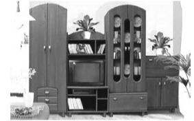
Стенка Олимп - 1612 руб. на 10 мес.