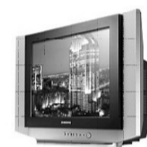
Телевизор Samsung Slimfit 54 см плоский экран - 706 руб. на 10 мес.