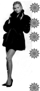
Норманн! Элегантные норковые шубки!!!

Приглашаем за покупками в четверг, в ГДК