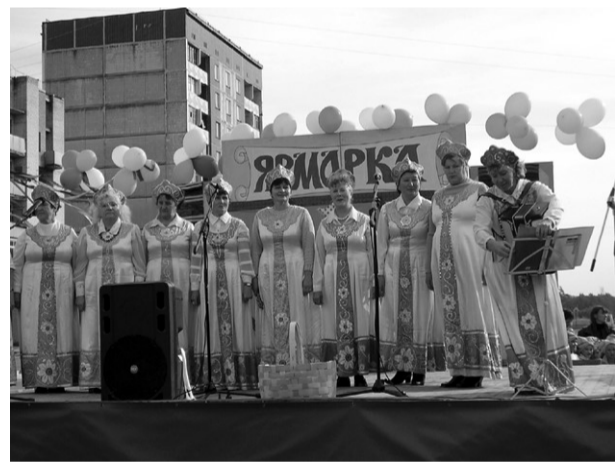
Фото и текст В.ГОРДЕЕВОЙ.

А еще весело было ребятам. Детишки охотно развлекались на надувных батутах. Их в этот раз несколько установили. Предлагались и всякие игры, конкурсы. Одним словом, ярмарка всем дарила и наслаждение, и хорошее настроение, и была щедрой, как это всегда бывало на подобных праздниках на Руси.