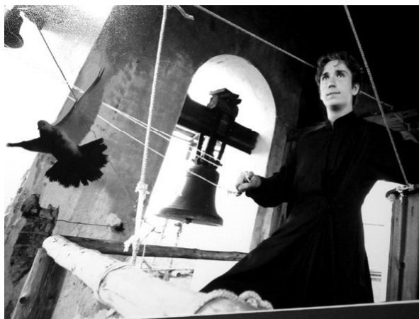
Митрополита Санкт-Петербургского и Ладожского Владимира сделаны настолько профессионально, что вряд ли найдется фотограф, который бы