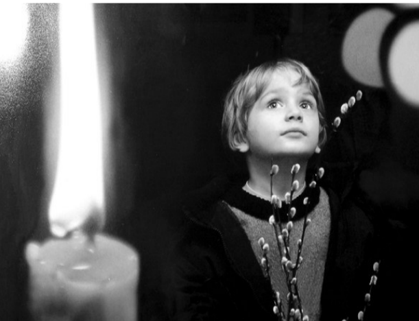
Работы Юрия Петровича поражают своей необыкновенной притягательной силой. Они ненавязчивы, и у него практически нет постановочных кадров, за исключением портретов. Фотохудожник показывает мир таким, какой он есть, он чутко улавливает моменты съёмки. Наверное, поэтому лица на всех его фотографиях светлые, и на них лежит особая «печать» веры в Бога. Даже мла-