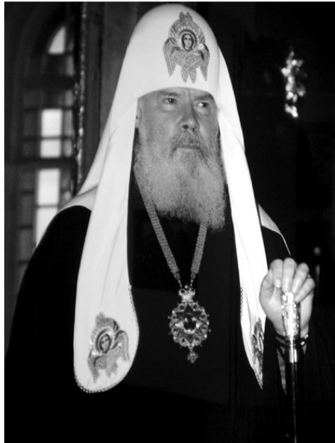
Епархиальный фотограф начал свою деятельность по возрождению православного сознания на Северо-Западе России ещё при владыке Алексии, нынешнем патриархе Московском и Всея Руси.