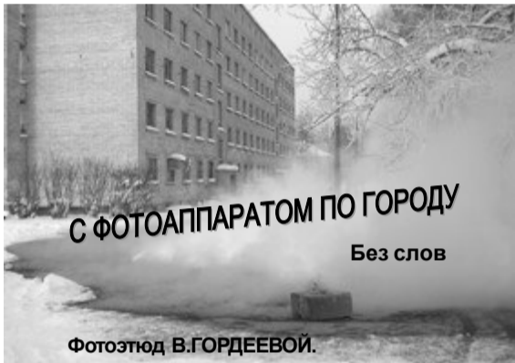
С ФОТОАППАРАТОМ ПО ГОРОДУ Без слов