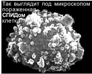
Так выглядит под микроскопом пораженная СПИДом клетка

СПИД вызывается вирусом иммунодефицита человека (ВИЧ). Этот вирус может жить в организме человека многие годы и заражать других людей, даже до появления каких-либо симптомов у вирусоносителя. ВИЧ делает человеческий организм неспособным противостоять даже обычным (неопасным) инфекциям и другим заболеваниям, с которыми здоровый человек легко справляется. При этом разрушается одна из важнейших систем организма – иммунная система, что в конечном итоге приводит к гибели больного. Человек становится заразным сразу же после своего заражения. Вирус СПИДа содержится во всех биологических жидкостях организма, однако наибольшее количество его (достаточное для заражения других людей) содержится в крови, семенной жидкости и вагинальных выделениях. Заражение происходит при внутривенном введении наркотиков совместно с лицами, уже зараженными ВИЧ (общий шприц, общая емкость с наркотиком, использование крови в приготовлении наркотического раствора); при нарушении правил заготовки и переливания донорской крови. Заражение может происходить при половых сношениях любым способом с зараженными ВИЧ лицами. Женщина, зараженная ВИЧ, может заразить своего ребенка во время родов и при кормлении его грудью. Заразиться мож-