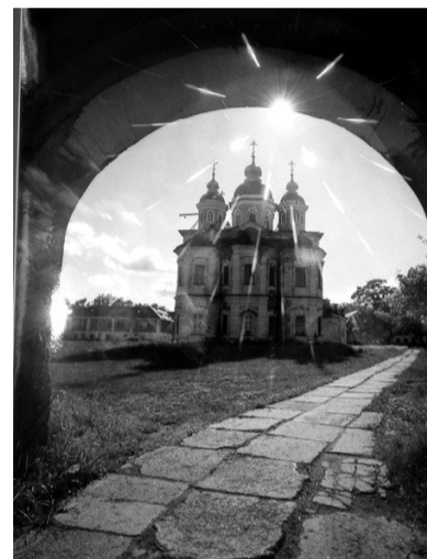
сделал это лучше С.П.Костыгова.