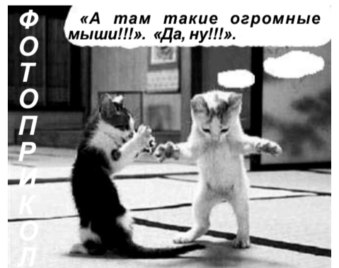
«А там такие огромные мыши!!!». «Да, ну!!!».

Наступает хорошее время, когда вам может встретиться много хороших людей. Удача будет сопутствовать вам во всем.