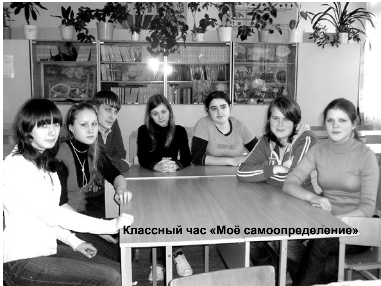
Классный час «Моё самоопределение»

Представительстве Санкт-Петербургского горного института (технического университета) в 2007 году продолжается работа по профессиональной ориентации, направленная на подготовку к поступлению и обучению в вузе. Будущие абитуриенты университета – школьники, учащиеся Сланцевского индустриального техникума, лицей, рабочая молодежь. Результаты анкетирования среди учащихся 11-х классов школ города показали, что в 2008 году более 90 человек желают поступить в Санкт-Петербургский горный институт.