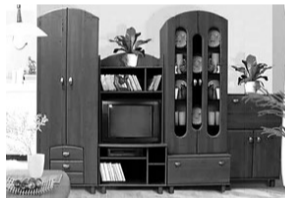
Стенка Олимп - 1465 руб. на 10 мес.