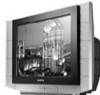
Телевизор Samsung Slimfit 54 см плоский экран - 706 руб. на 10 мес.