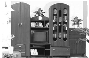
Стенка Олимп - 1465 руб. на 10 мес.