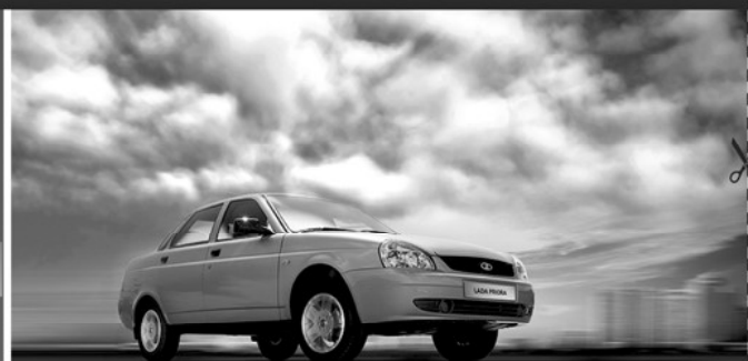
LADA Priora На всех дорогах страны