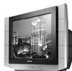
Телевизор Samsung Slimfit 54 см плоский экран - 706 руб. на 10 мес.