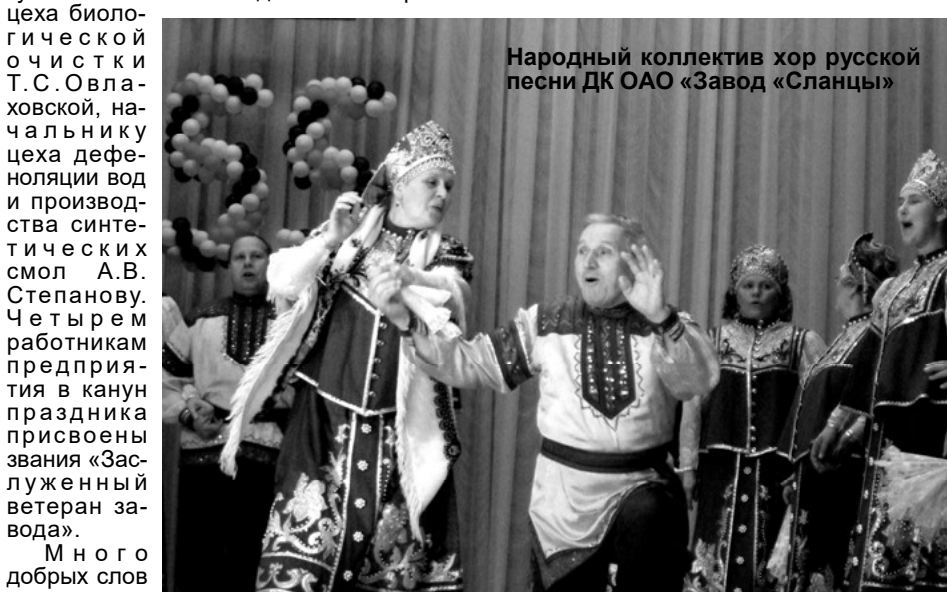
Народный коллектив хор русской песни ДК ОАО «Завод «Сланцы»

уровне во Дворце проходят концертные юбилейные программы с участием санкт-петербургских артистов. На этот раз зритель был предложен ретро-песни в исполнении бывших солистов групп «Поющие гитары», «Синяя птица», другие номера. Зрители встречали и гостей, и своих, сланцевских артистов, громкими