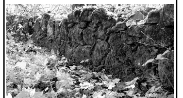
Ольгин Крест. Валуны ограда погоста.

Валуны (эратическое) — обломки горных пород, слегка округленные и, как показывает самое их название, являющиеся чуждыми пришлецами, как бы заблудившимися в той местности, где они находятся. Жители наших северных губерний — Олонецкой, Вологодской, Петербургской, Финляндских и т. д. хорошо знакомы с этими валунами, которые часто переполняют их поля и в значительной степени затрудняют пахоту. В менее значительном количестве и менее значительных размеров В. кристаллических и других пород известны в средней России и даже отчасти в южной. В. принадлежат обыкновенно породам, совершенно чуждым той местности, где залегают, и коренные месторождения которых находятся на сотни и даже тысячи верст к северу, северо-западу или северо-востоку от данного места.