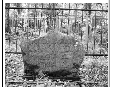
Ольгин Крест. Внехрамовый погост. Современные словорубные работы, выполненные умельцем из д. Загривье.

Так, например, во многих местах средней России находят В. красного олонечского, так называемого «шокинского» кварцита, во многих местах и даже вплоть до Киева находят В. выборского гранита «рапакиви»; северная Германия избилует В. скандинавских пород и т. д. Многие В. покрыты одной или несколькими пересекающимися под косыми углами системами параллельных тонких или грубых штрихов и борозд (так называемые ледниковые шрамы, борозды) или с одной или нескольких сторон совершенно отполированы, часто до степени зеркальной полировки («ледниковая полировка»).