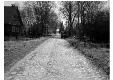
Мостовая сооружена в 1930-е гг.

Эрратические валуны бывают самых разнообразных размеров: с орех, с кулак, с голову и до гигантских исполинов, достигающих иногда нескольких десятков тысяч пудов. Примерами этих последних могут служить: на острове Коневец (Ладожское озеро) так называемый «конец-камень», на котором построена часовня, и пьедестал памятника Петру Великому в С.-Петербурге, представляющий только часть громадного В. из окрестностей столицы.