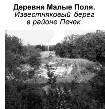
Деревня Малые Поля. Известняковый берег в районе Печек.