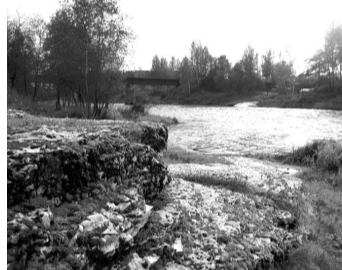
Мыза Гавриловское. Выходы известняка.