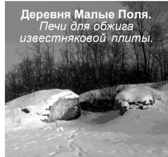
Деревня Малые Поля. Печи для обжига известняковой плиты.

Весьма полезно будет произвести картирование этого уникального объекта, пусть недавнего по времени. Сегодня сложно установить время начала функционирования печек. О последних сроках работы на них вспоминают старожилы Сланцев. С началом строительства города где-то было налажено промышленное производство извести. Железная дорога подвозила цемент. Это и свело местный «выдающийся промысел» на нет. Сегодня еще можно наблюдать строения и сооружения из плиты. Но с десятилетиями их остается все меньше и меньше.