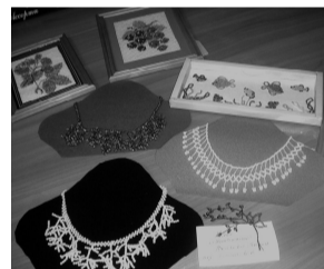
На снимке: творческие работы ребят подросткового клуба «Дружба».