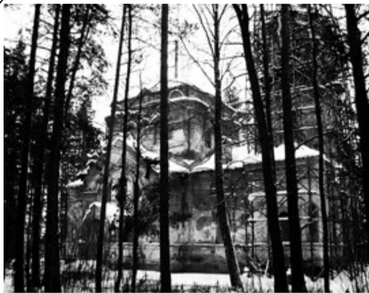
В.ОРЕХОВ Посвящается церкви в Зажупанье

Это что за наваждение? Прицепился как репей. Днём и ночью нет покоя, В три ручья, Хоть слёзы лей. Он меня заколдовал. Сделать шагу не могу, По рукам, ногам сковал... Слов не подберу. Что мне делать? Подскажите! Это ж надо так страдать! Он же, форменный вредитель, Не могу ни есть, ни спать... ...мне кто-то шепчет о любви, а кто-то о разлуке... Пылает страсть в моей крови, За что, такие муки?!