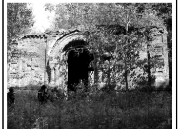
Поруганный храм в с. Шавково.

Дочь рассказчицы показала нам место якобы бывшей церкви петровских времен (место у Разлога, в сторону Шавковского поворота). Здесь при обустройстве дороги и моста через ручей посыпались во множестве кости и черепа. Камни при дороге, многие из которых колотые, жители приняли за камни фундамента храма. Фактически дорожники разрушили часть большого жальничного могильника. Камни до сих пор образуют правильные ряды. Это замечательный памятник археологии не известный по сборнику Лапшина. Сверхка по плазовым книгам 1498 года дает понимание того, что это кладбище при старинной деревне Васихина Гора. Когда деревня перестала существовать, не известно. Память о ней полностью исчезла.