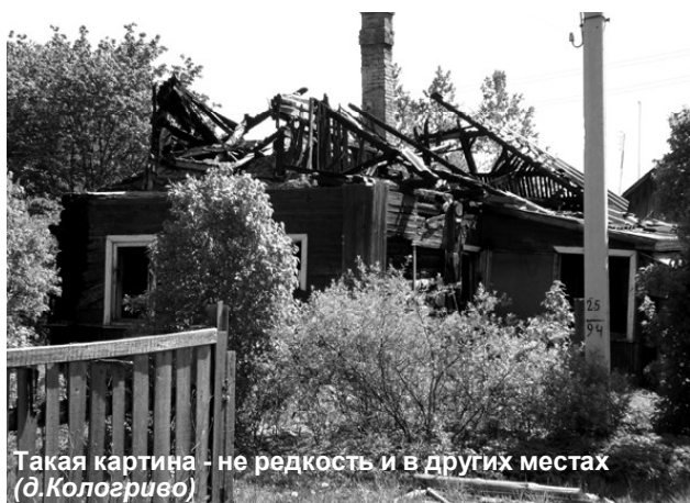
Такая картина - не редкость и в других местах (д. Кологрово)

Обустройство территории вокруг частных домовладений. Это показатель культуры граждан и уровня требовательности со стороны органов местного самоуправления. Больших успехов в этом отношении мы не увидели. Домовладений, вокруг которых обкошена прилегающая часть улицы, в лучшем случае, единицы. Хотя встречаются и такие оазисы: территория домовладения имеет идеально ухоженный вид, вокруг выкошено. Но через дорожку - кучи хлама. Думается, порядок и благоустройство вокруг частных домовладений необходимо подробно изложить в правилах благоустройства каждого поселения и требовать их неукоснительного соблюдения, не останавливаясь перед применением административных мер. Право составления протоко-