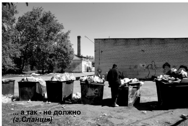
... а так - не должно (г. Сланцы)