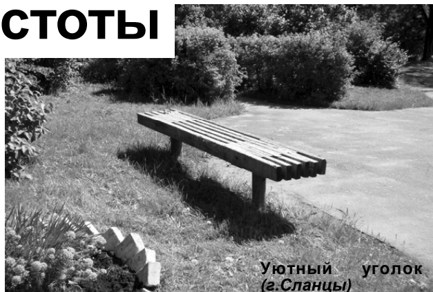
Уютный уголок (г. Сланцы)

лов есть у администраций, а при необходимости можно привлекать сотрудников ОВД.