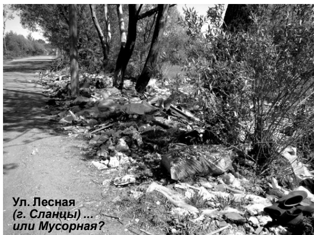
Ул. Лесная (г. Сланцы) ... или Мусорная?