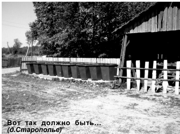
Вот так должно быть... (д. Старополье)