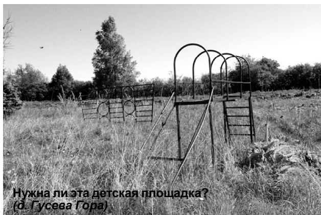
Нужна ли эта детская площадка? (д. Гусева Гора)