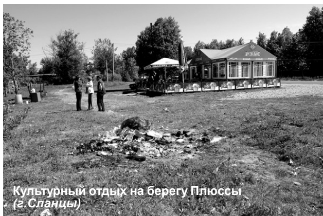
Культурный отдых на берегу Плюссы (г. Сланцы)