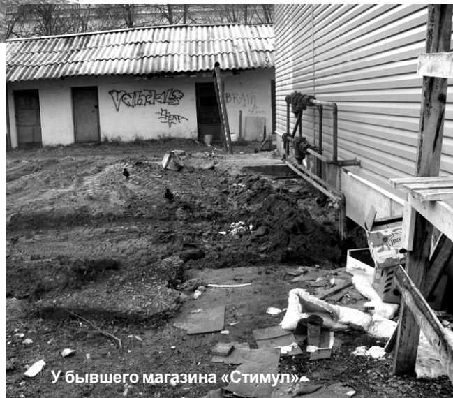
У бывшего магазина «Стимул»

Зима, как известно, добавляет хлопот дорожной службе, особенно в период большого снегопада, а также нелегко работать и тем организациям, которым приходится устранять прорывы на водоводе, теплотрассах и т.п. Ведь им приходится вскрывать газонные, тротуарные и дорожные покрытия, то есть нарушать благоустройство территорий. Но для всех существует правило, что после проведения земляных работ, обязательно произвести благоустройство, согласовав свои действия со специалистами комитета по управлению городским хозяйством муниципального образования Сланцевское городского поселения. Однако на деле это происходит не всегда. В результате получается, что некоторые улицы города становятся похожи на кадры из фильмов, где проходят боевые действия. Долгое время в открытом состоянии находится теплотрасса по улице Ленина, причем, никакого ограждения там нет, и любой гражданин в тёмное время суток может попасть в ловушку, как это уже произошло на улице Ломоносова. И как тут не поверить русской поговорке: «Гром не грянет, мужик не перекрестится». Только после несчастного случая глубокую траншею зарыли за один день. Правда, кое-как, с помощью бульдозера, а поребрик так и остался валяться на обочине. Конечно, можно все «свалить» на зиму – что невоз-