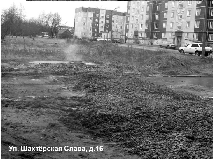
Ул. Шахтёрская Слава, д. 16