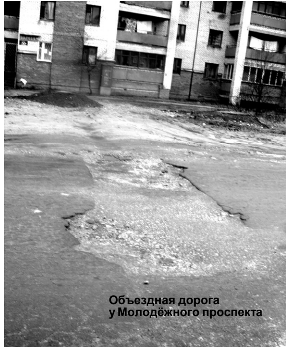
Объездная дорога у Молодёжного проспекта