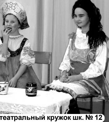
Выступает театральный кружок шк. № 12