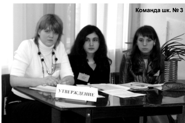
Команда шк. № 3

игре команде школы № 3 выпало раскрыть тему с позиции утверждения. Спикеры убедительно говорили о том, что демократические выборы меняют политику государства: избираемые, участвуя в выборах, играют главную роль в определении