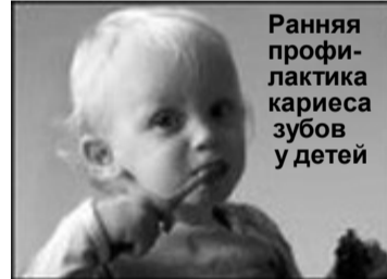
Ранняя профилактика кариеса зубов у детей

Кариес зубов у маленьких детей можно предотвратить, если не выражать свою любовь к ребенку в большом количестве сладких угощений. Взрослые очень часто приучают детей к сладостям с пеленки, давая все продукты питания исключительно подслащенными. Чисткой зубов родители часто предпочитают «не мучить» малыша или целиком и полностью доверяют ему этот сложный процесс. Из-за обилия сладостей и плохой гигиены риск развития кариеса у ребенка повышается. Чтобы не допустить появления кариеса на молочных зубах, необходимо: ухаживать за зубами ребенка с момента их прорезывания: вначале мыть кипяченой водой и марлевым тампоном после каждого приема пищи, а затем – к годовалому возрасту – перейти к осторожному использованию зубной щетки и пасты.