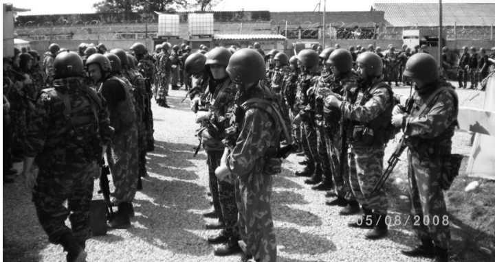
тами пытаются договориться, привлекают для убеждения родственников, других влиятельных людей, и только потом применяют оружие. За полгода отряд обезвредил несколько группировок, изъял боеприпасы, не-