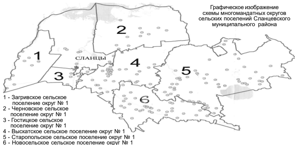
СХЕМА избирательных округов по выборам депутатов совета депутатов второго созыва и должностных лиц местного самоуправления муниципальных образований Сланцевского муниципального района Ленинградской области