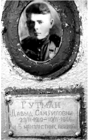
Эту публикацию мы решили отправить в Центральный военный архив. Может быть, там остались сведения о 25-летнем защитнике Отечества, погибшем за нашу сланцевскую землю. В.ГАЛКИНА.

мятники по контракту обслуживаются ООО «Доррос». В преддверии Дня Победы были открыты новые страницы истории Великой Отечественной