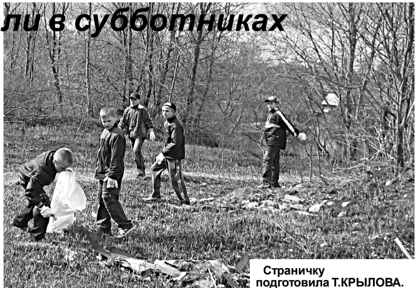
Страницку подготовила Т.КРЫЛОВА.