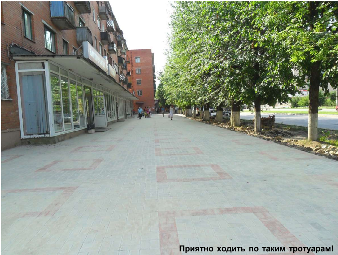
Приятно ходить по таким тротуарам!

Газета ИЗДАЕТСЯ с февраля 1944 года Пятница, 23 июля 2010 года № 28 (14485) Цена договорная