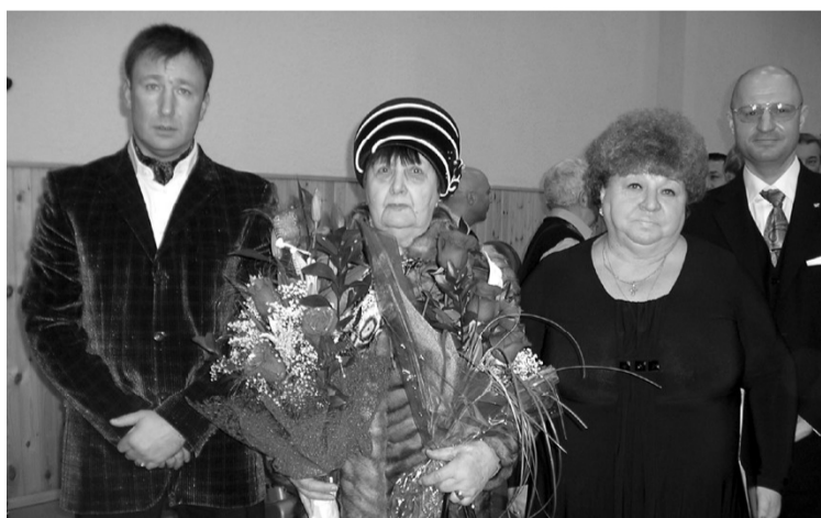
Фото и текст Т.КРЫЛОВОЙ.

Торжественные мероприятия продолжились в Городском Доме культуры. Здесь состоялся и концерт Олега Газманова.