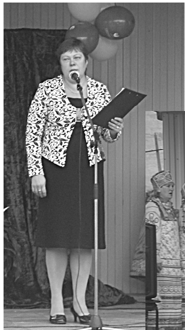
Фото и текст В.ГОРДЕЕВОЙ.

Праздничное торжество длилось несколько часов, но никто не устал, было весело и интересно, а в заключение все с удовольствием пустились в пляс под звуки знакомых мелодий.