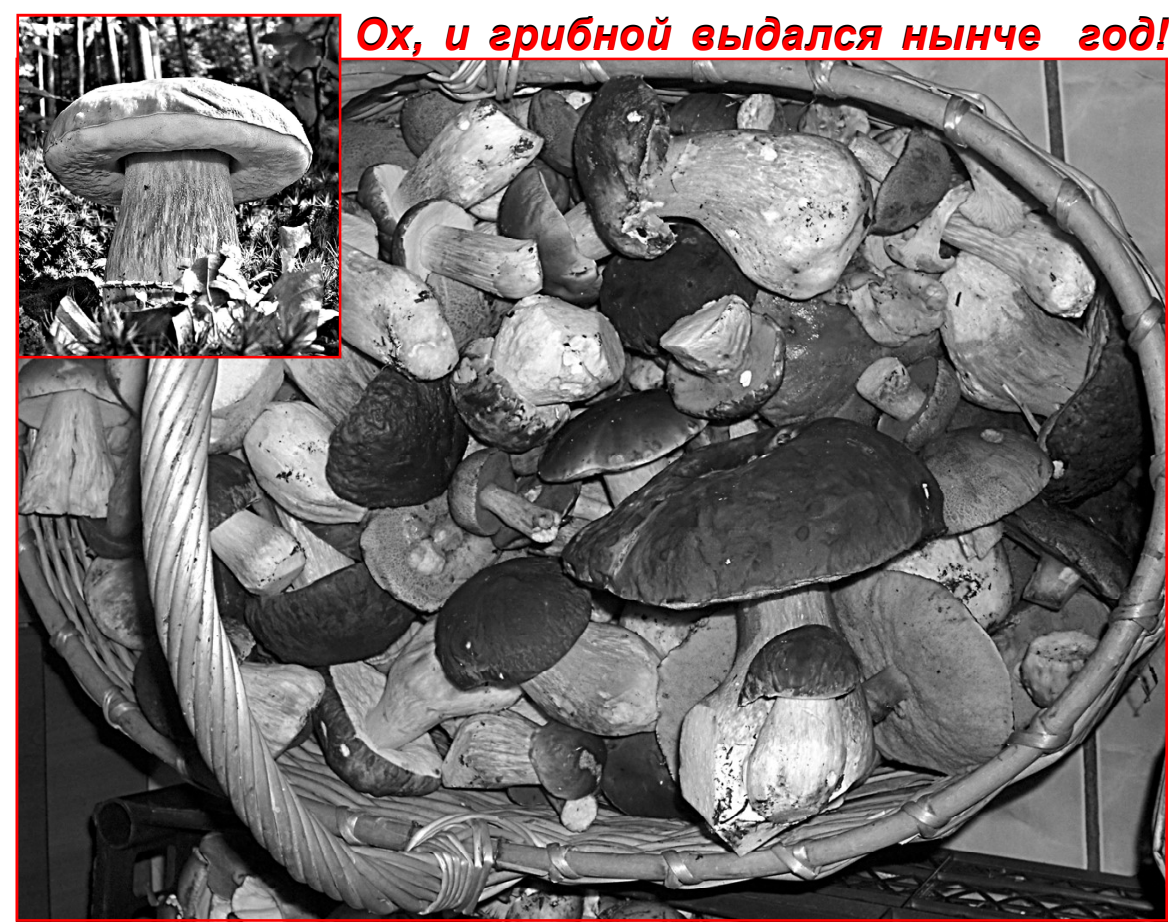
Ох, и грибной выдался нынче год!

СЕГОДНЯ В НОМЕРЕ Н есмотря на реорганизацию лесного хозяйства, неизменной остается традиция отмечать профессиональный праздник – День работника лесного хозяйства. Стр. 5.