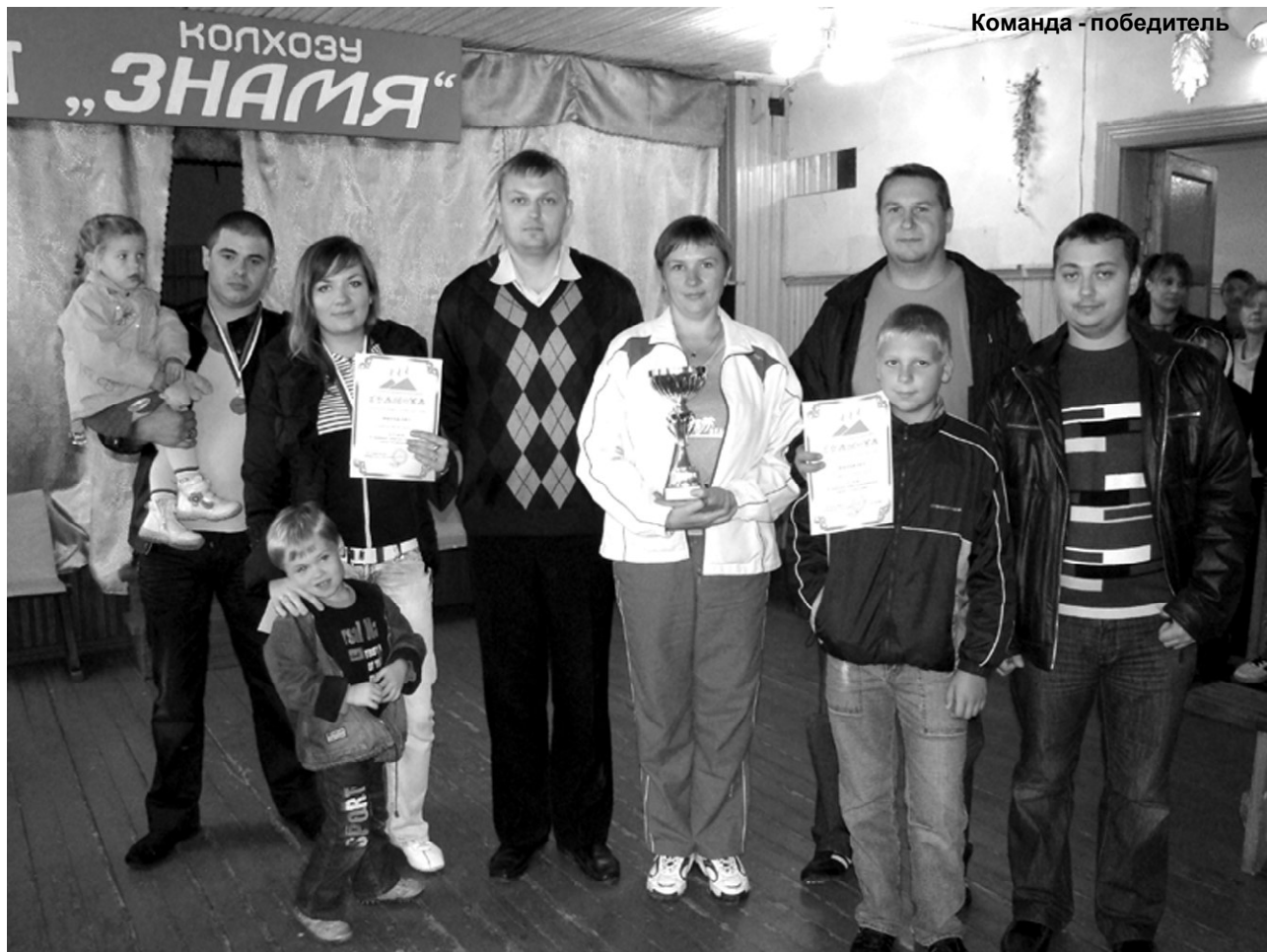
Команда - победитель