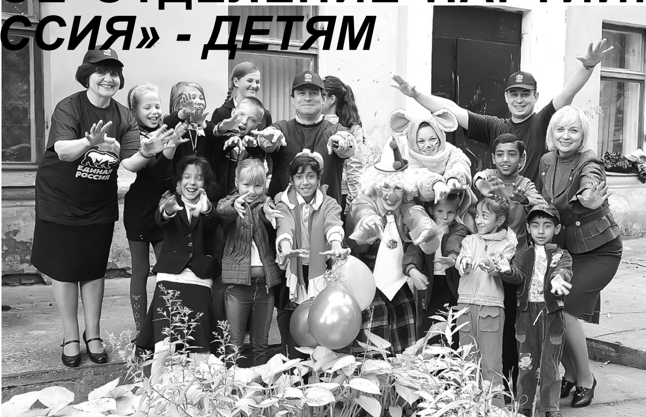
ПРАЗДНИК В «МЕЧТЕ» ГЛАЗАМИ ОЧЕВИДЦА И УЧАСТНИКА