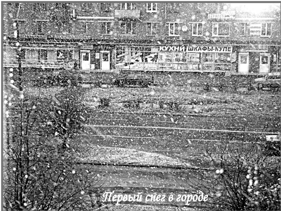
Первый снег в городе